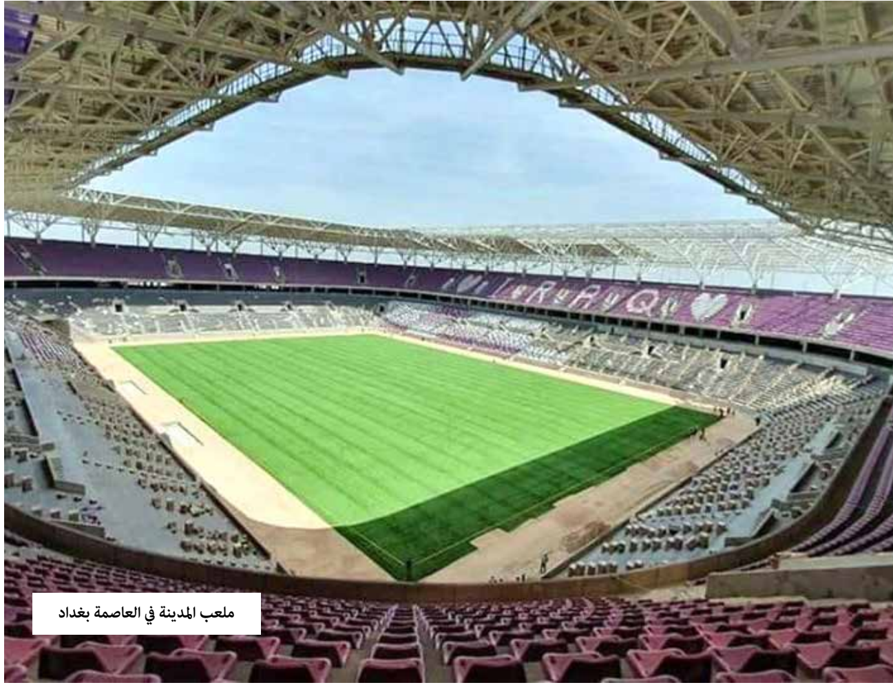
ملعب المدينة في العاصمة بغداد

يلتقي اليوم الثلاثاء، المنتخبان العراقي والإيراني في مباراة ختام بطولة غرب آسيا للمنتخبات الاولمبية دون سن 23 عام التي جرت في بغداد وكربلاء، وستقام المباراة على ملعب المدينة في العاصمة بغداد.