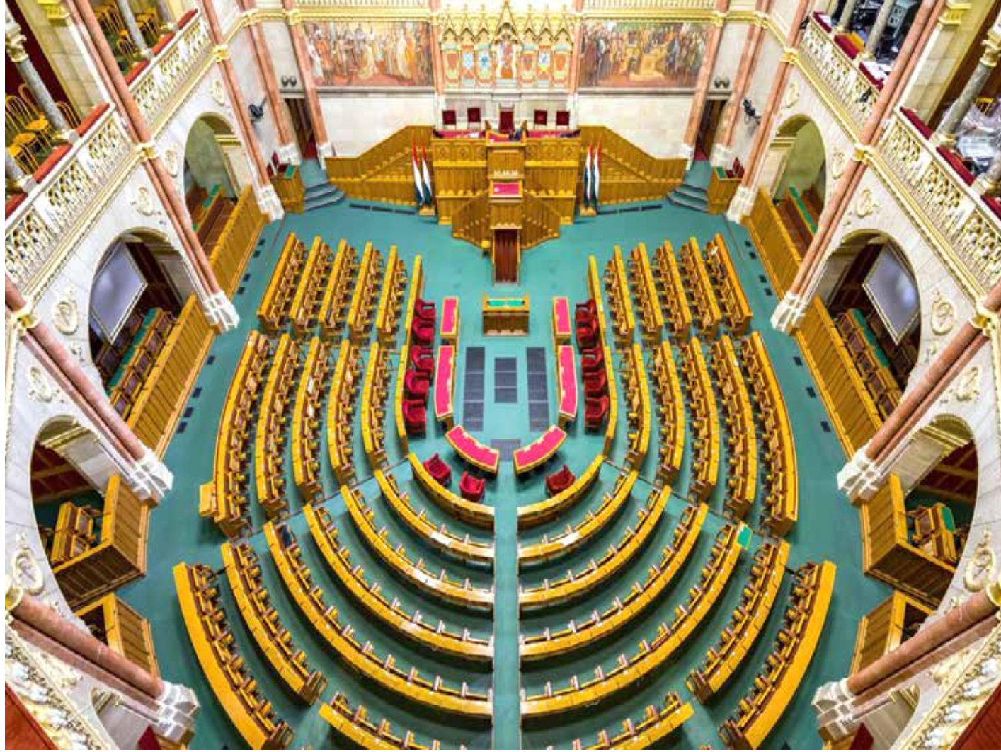
قاعة البرلمان في المجر

المقام الأول. بينما ترفض بقية الدول الأعضاء في الاتحاد الأوروبي موارد الطاقة الروسية وتشتريها من الولايات المتحدة بأسعار باهظة، يواصل الجانب المجري التعاون مع روسيا في هذا المجال. لذلك، في أبريل، اتفقت المجر مع الحكومة الروسية على إمدادات الغاز الزائدة عن العقد عبر الخط التركي. كما اتفق الطرفان على نظام دفع تفضيلي لعقد الغاز الرئيسي طويل الأجل وعلى إمكانية الدفع المؤجل إذا تجاوزت حداً كبيراً في حالة حدوث زيادة كبيرة في أسعار الغاز.