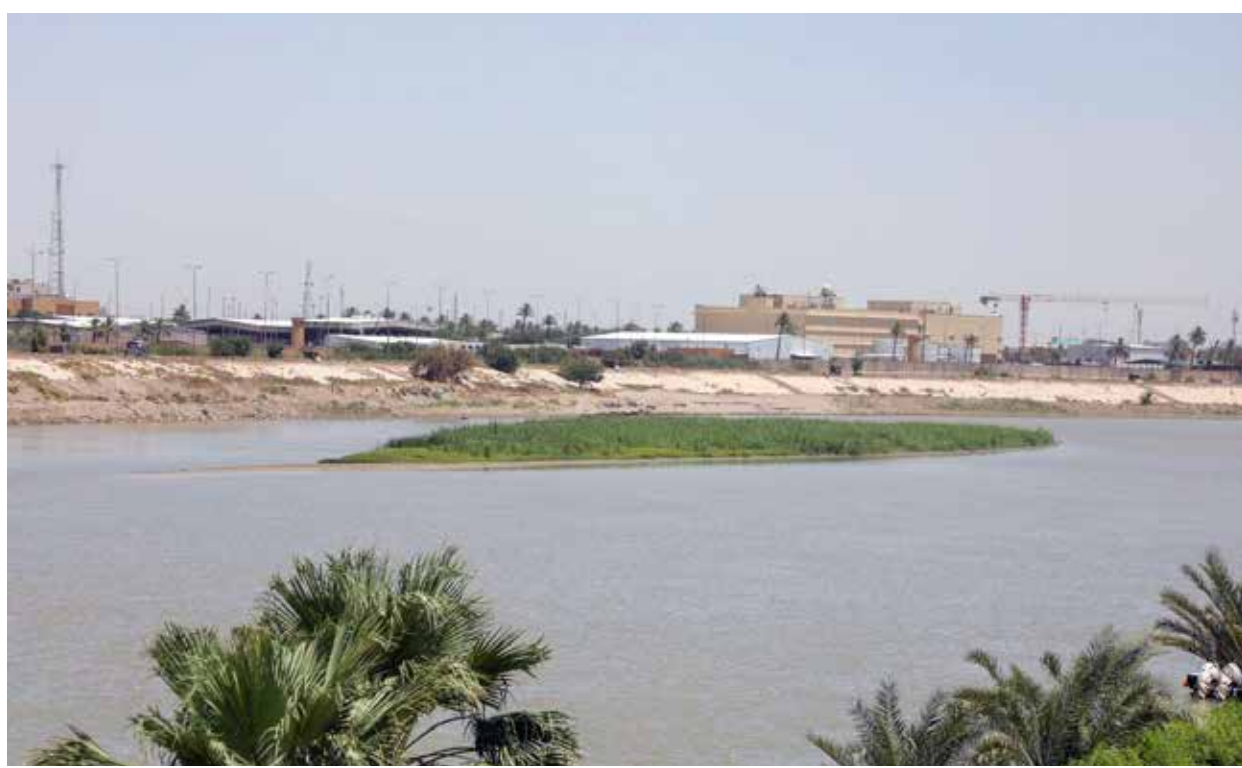
تعاطم خطر شح المياه بسبب السياسات المائية المحجفة لدول المنع تجاه العراق &lt;&lt; 3 زين يوسف

مراسل «طريق الشعب» في جانب الرصافة، أكد أن