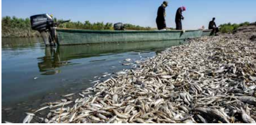
نوفق ملايين الأسماك سنويا بفعل انخفاض مستويات المياه وارتفاع ملوحتها

ويلفت كردي إلى أن "بحيرات الأسماك ساهمت في امتصاص البطالة وإنعاش حركة المطاعم وتجارة الأعلاف. وحقت مردودات مالية كبيرة لصالح الاقتصاد المحلي".