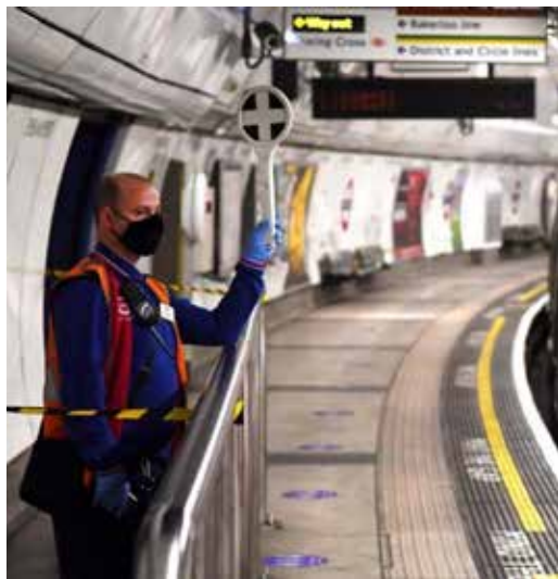
متابعة - طريق الشعب

نظم عمال السكك الحديدية في بريطانيا، مؤخرًا، إضراباً جديداً احتجاجاً على الأجور وظروف العمل، مع استمرار موجة الإضرابات منذ أكثر من عام.