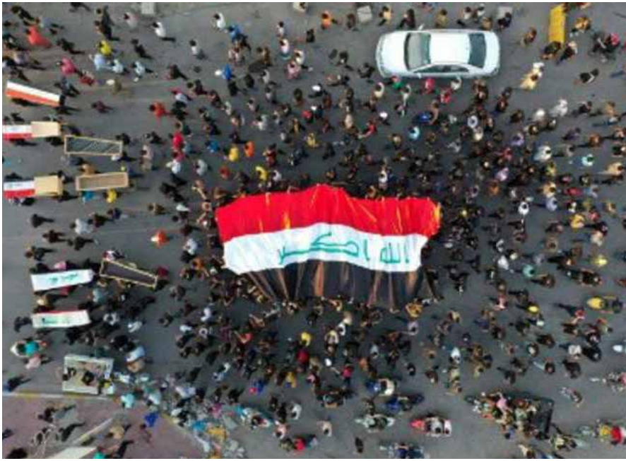
من احتجاجات ميسان ابان انتفاضة تشرين 2019

وخلص موجهاً دعوته الى مفوضية الانتخابات لان "تأخذ دورها بجديّة ومسؤولية عالية، لضمان نجاح الانتخابات بدون اخفاقات، وان تتحرر من ضغوط القوى المنتهزة في السلطة، وان تتعاطى مع جميع القوى المشاركة في الانتخابات بشكل متساو".