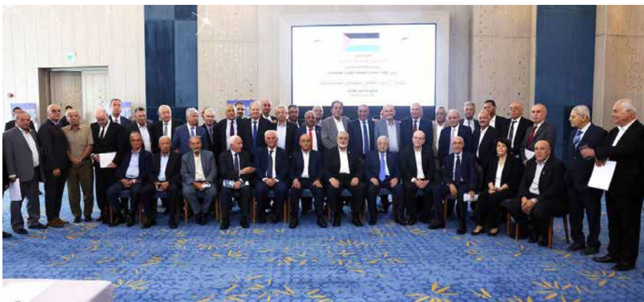
اجتماع الامناء العامين للفصائل الفلسطينية

شدد الامين العام لحزب الشعب الفلسطيني باسم الصالحي، على ان "منظمة التحرير الفلسطينية هي الممثل الشرعي والوحيد للشعب الفلسطيني