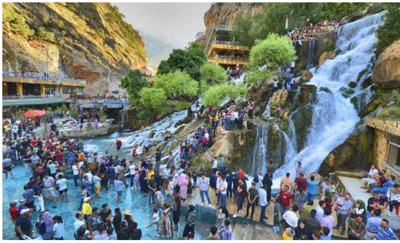
هروب جماعي للمواطنين الى شلالات جبال كردستان بسبب ارتفاع درجات الحرارة

وفيما إذا كانت هذه التعليمات كافية لضبط الدعاية، يؤكد ضياء الدين لـ "طريق الشعب"، على أنه "بشكل عام تعتبر هذه التعليمات هي الضابط الوحيد لعملية